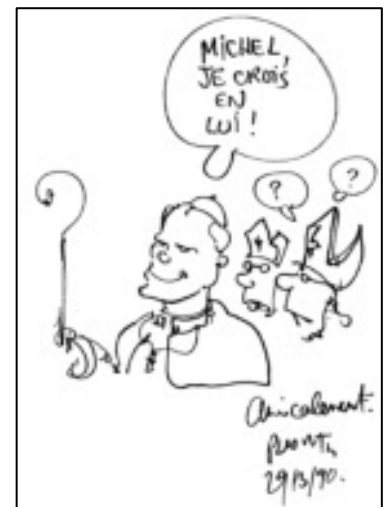
Dessin réalisé par Plantu pour le Père Michel.

Je vous laisse en « testament » (du mot latin testamentum dont le sens premier est « témoignage ») trois Paroles du Christ qui ont stimulé ma route.