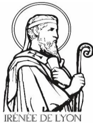
IRÉNÉE DE LYON

« La gloire de Dieu c'est l'homme vivant, et la vie de l'homme c'est la vision de Dieu »